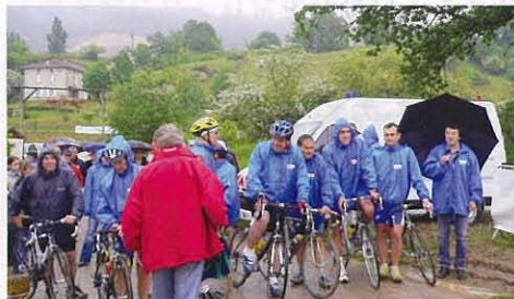
Immune Ageのロゴの入ったウインドブレーカーが大活躍