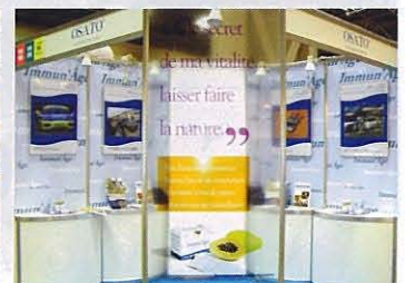
透明感のある上品なブース