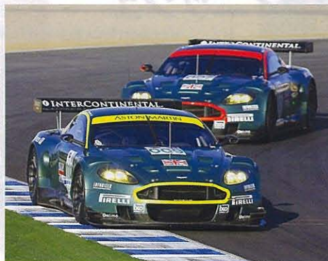
ランデブー走行をする9号車と7号車

した臨床検査の対象となります。この研究を進めることによって、より安全なレースを目指します。