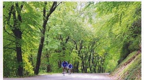
時折、木漏れ日の差す大自然の中を駆け抜ける