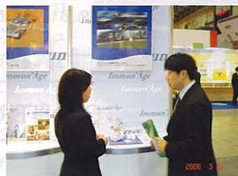
熱心に質問する来場者

いう大里研究所らしいセミナーも好評で、セミナー後、出展ブースにまで熱心に質問に来られる方もあり、イミュナーゼに対する関心の高まりが感じられました。