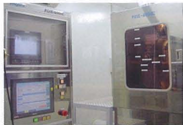
ISOへの取り組みとして、環境へ配慮して緑化運動を推進。工場内部では異物混入検査機をはじめ、最新鋭の機器を完備。

着実に広がっています。大里インターナショナルは、海外にOSATO Distribution Ltd.、OSATO USAの拠点を持ち、フランス、イタリアでは処方薬局で販売されるなど国際的に高い評価を得ています。