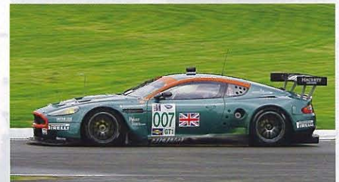
テクニカル・パートナー、Immun'Ageのロゴがドア下に