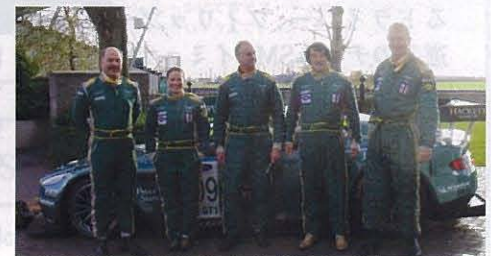
インターコンチネンタルホテルはじめ、AMR(アストンマーチンレーシング)のパートナー達と林社長