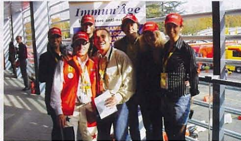
イミュナーゼ・フェラーリのレースクイーンと