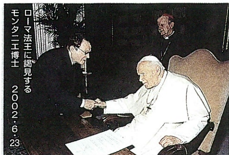
ローマ法王に謁見する モンタニエ博士 2002.6.23

ローマ法王ヨハネ・パウロ2世は、在位23年余りで100回近い外遊を行い、「空飛ぶ聖座」の異名を持つほど精力的な活動を続けてきました。しかし、83歳という高齢と最近では持病のパーキンソン病の進行が進み、法王の激務にいつまで耐えられるかが懸念され、実に800余年ぶりの存命中の退位説も浮上していました。2002年6月、バチカンを訪れたリュック・モンタニエ博士（エイズウィルスの発見者として有名なパスツール研究所教授・世界エイズ予防研究財団理事長）が、法王の健康回復のために…と“FPP”を直接手渡され独自の治療を勧めたのです。このニュースはイタリアの新聞トップで大きく報じられました。